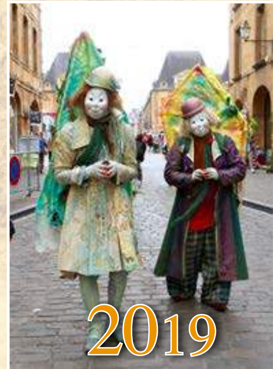
Des histoires à rêver debout