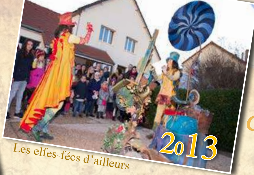
Les elfes-fées d'ailleurs