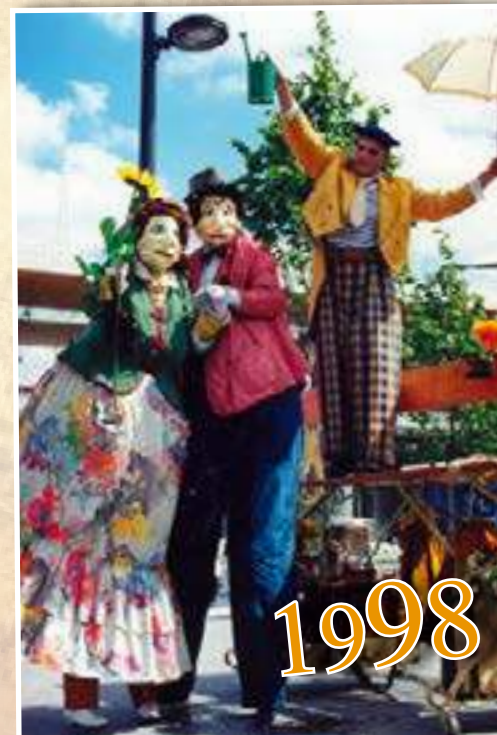
Piano Piano se va lontano