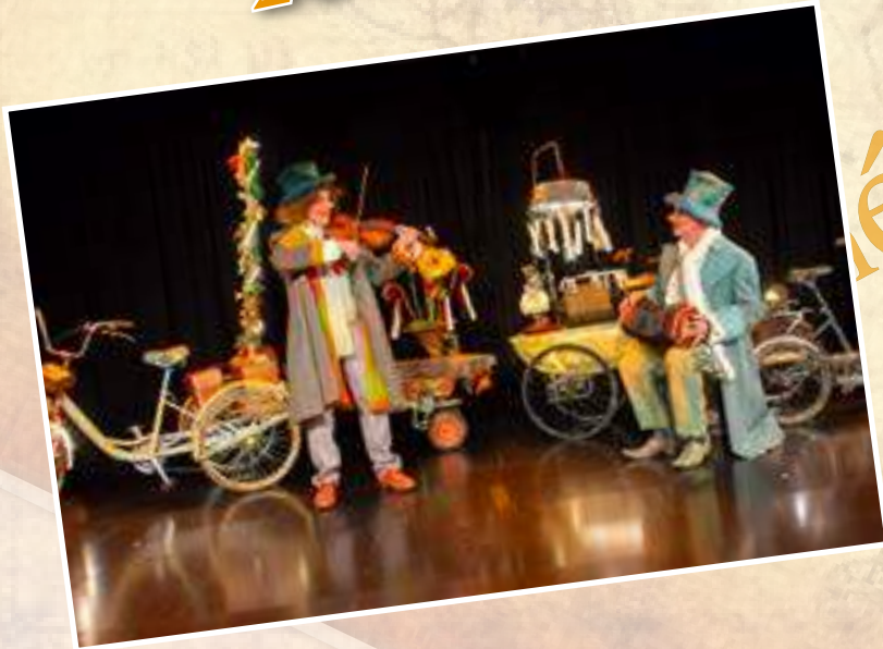
Les voyageurs errants