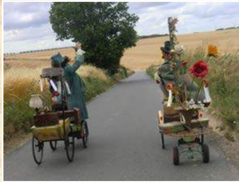
Les Passeurs de rêves